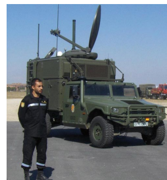
El Comandante Carmelo Benito en la Unidad Militar de Emergencias de Zaragoza (España)

Base Aérea de Torrejón. En total, una vez finalice el proceso de constitución de la UME como ya he mencionado, 3.987 hombres y mujeres.