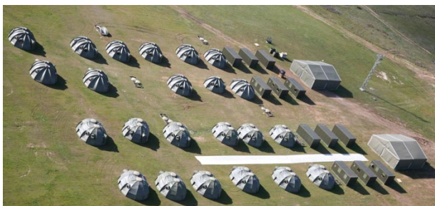
Campamento para unas 5.000 personas

Como ya he dicho, la UME está para grandes emergencias o situaciones graves que se consideren. El Regimiento de Apoyo será capaz de montar un campamento para alojar a personal desplazado de sus hogares, por razón de una emergencia, que contará con capacidad para un total de 5.000 personas. Este campamento dispondrá de módulos de alojamiento por familia que cuentan con casi todas las comodidades como son calefacción, aire acondicionado, TV, etc. Además, existirán otros módulos